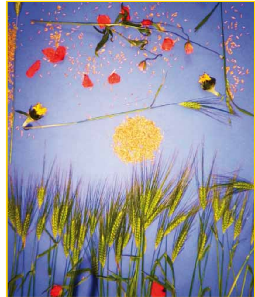
Volksschule Buchkirchen 3a